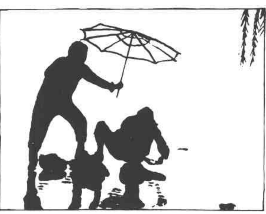
本版编辑 王劲君

爷爷，人是不是岁数越大心眼儿就越小？ 这听谁说的？ 听谁说的？我自己发现的。 是嘛，那你讲给爷爷听听。 你看刘阿姨家的款款，吃奶淘气，刘阿姨打他一巴掌，眼泪还没干呢，就趴在刘阿姨怀里咯咯笑了；王叔叔家的大洋，上小学三年级了，为他不好好写字，王叔叔踢了他一脚，还没使劲呢，他三天没跟王叔叔讲一句话。你再瞧我爸，就为您给了姑姑二百块钱，两年不来给爷爷过生日了。 傻孩子，要不是你姑姑、姑夫下岗没工作，爷爷……大人的事小孩别多嘴。 爷爷，我有个好办法。我爸爸和我妈妈约法三章，其中一条：生气不准超过一小时。你也跟爸爸约法三章嘛，可回头我也跟爸爸说说。 不许瞎说，那你爸爸会更生爷爷的气。你长大娶了媳妇，别别招你爸爸生气，人上了年纪就怕生气，记住不？ 嗯，记住了爷爷，等爸爸老了，我对爸爸和媳妇一样好。